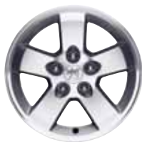
Легкосплавные колёсные диски Танганияка, 18"