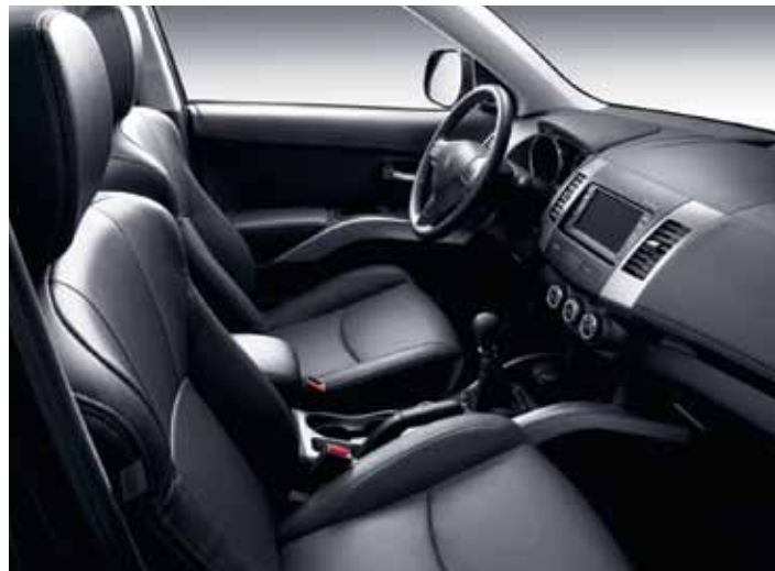
Кожаная отделка салона Dulce Astrakan