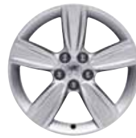
Легкосплавные колёсные диски Manyara, 16"