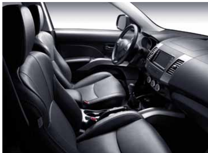
Тканевая обивка салона Книт ( для уровня Access)