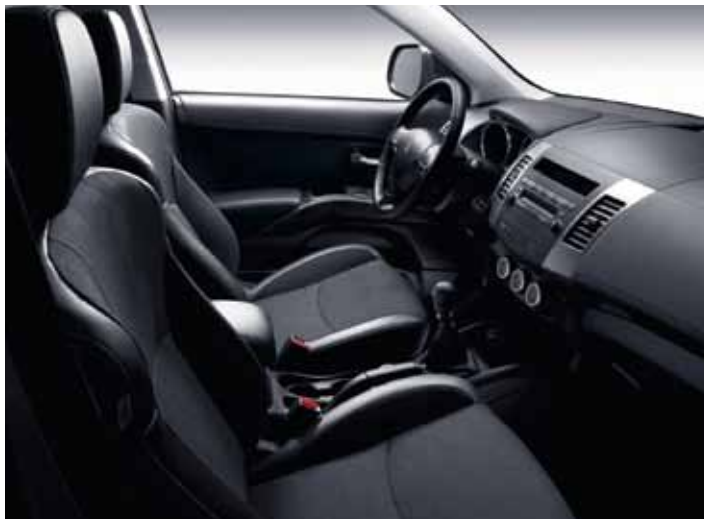
Комбинированная отделка салона Diamant