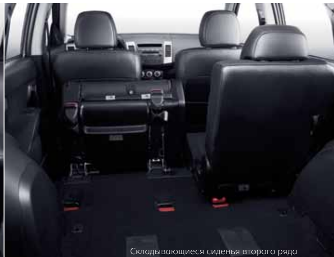
Складывающиеся сиденья второго ряда