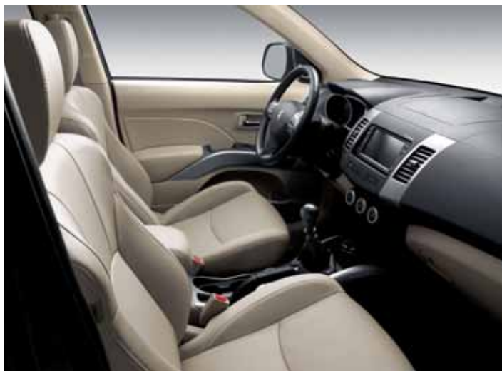
Кожаная отделка салона Dulce Beige Mitsi